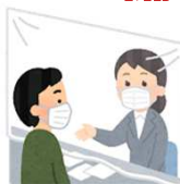
アクリル板・パーティション